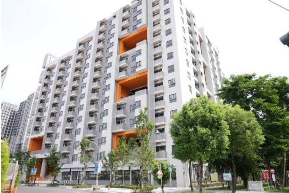
員和青年社會住宅

新北市政府青年局（下稱本局）運用土城員和青年社會住宅打造土城綠創基地(土城區莊園街 151 號 2 樓)，鄰近海山捷運站，招募具節能減碳、環境友善、永續循環、ESG 主題等具綠色創新特色之相關技術、產品、服務或構想之新創團隊進駐基地，提供辦公空間、業師輔導、創業課程等資源，協助新創團隊進行市場驗證、商機合作、促成募資及加速事業發展，活絡新北綠色永續產業發展。