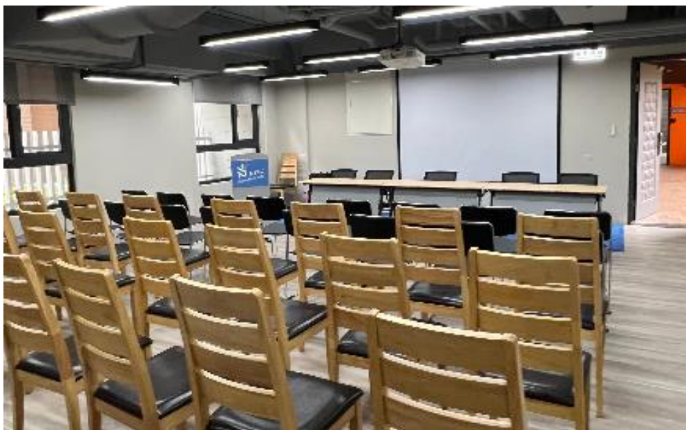
土城綠創基地活動空間